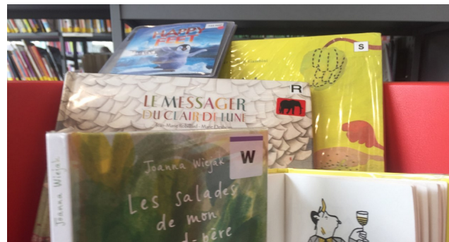
Sélection de livres du rayon jeunesse de la médiathèque

La majeure partie des livres est régulièrement empruntée. Toutefois, il peut persister certains ouvrages qui ne trouvent jamais abonnés à leurs pages. Dans ce cas, tous les ans, une braderie est organisée et les livres sont revendus à très bas prix. La médiathèque Jacques Demy possédant un plus grand espace de stockage est quant à elle en mesure de conserver les ouvrages et de les reproposer à l'emprunt ultérieurement.