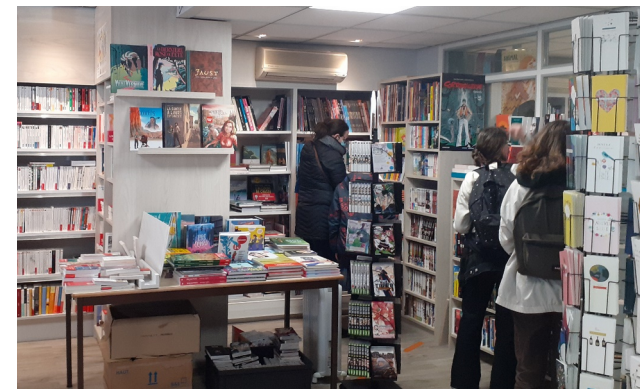
La librairie propose aussi de la papeterie, des cartes par exemple.

Pourquoi ouvrir une librairie ? En effet, nous savons que les espaces commerciaux et les grandes enseignes prennent aujourd'hui une grande place dans notre quotidien et que les petits commerces en souffrent.