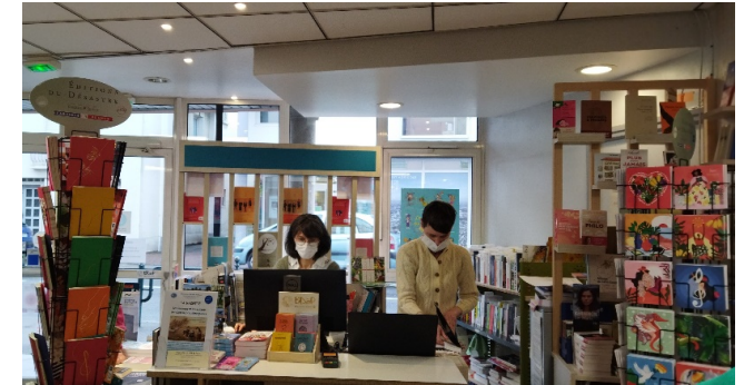
La caisse de la librairie

L'accueil et les échanges avec les bibliothécaires, ainsi que la rencontre avec des usagers de ce lieu public ont été très intéressants.