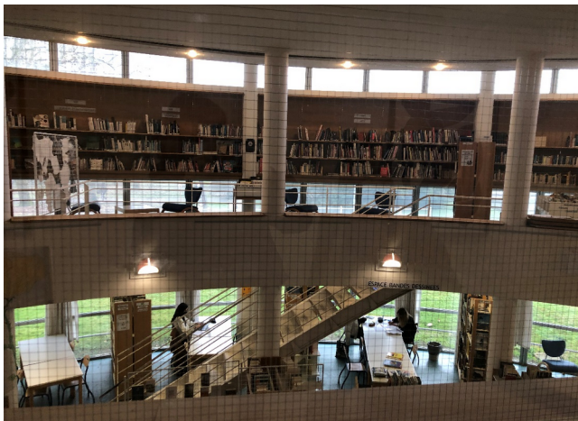
Vue d'ensemble du CDI : rez-de-chaussée et étage

Dans le CDI du lycée, les formats que l'on retrouve le plus sont les romans avec un total tout compris de 2739 livres sur les 7705 disponibles au prêt.