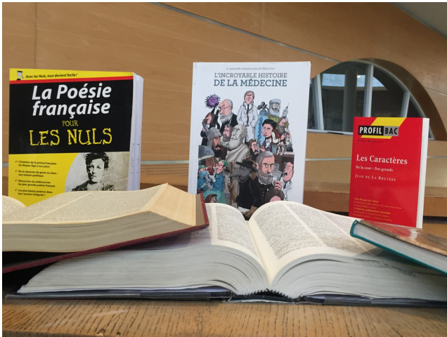
Gros plan sur quelques ouvrages du CDI.

Après avoir réalisé cette observation, nous prenons conscience de la complexité de ce lieu et particulièrement de sa gestion.