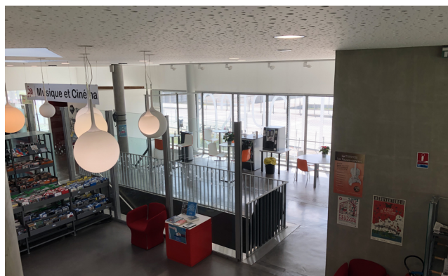
Une partie du rez-de-chaussée de la médiathèque

Les médiathécaires organisent de nombreux événements pour favoriser l'accès aux livres et à la culture. Ils valorisent notamment le public en situation de handicap en diffusant des films en audio description par exemple, ils organisent des activités pour les plus jeunes, comme des expositions, pêche à la ligne, installation d'une tente de lecture pour les plus petits... Pour les adolescents, des sessions de jeux en ligne sont organisées et une salle de travail avec un accès à internet de 2h par jour sont mis à disposition des étudiants (collégiens, lycéens, universitaires).