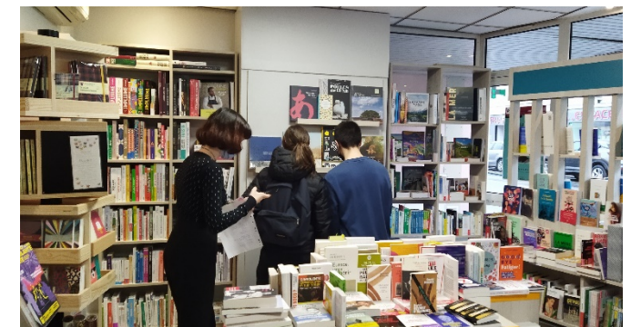
Salle principale de la librairie

Un projet futur d'agrandissement est prévu pour pouvoir acheter plus d'ouvrages et avoir une boutique aux normes d'accessibilité pour les personnes handicapées.